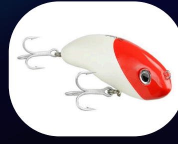
Safada - Borboleta