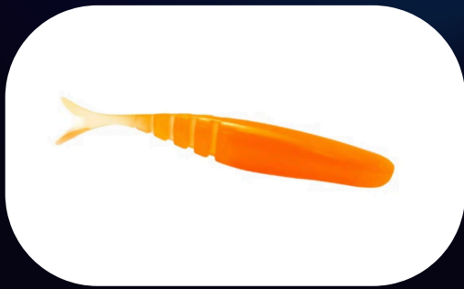
M-Action 15 - Monster 3x