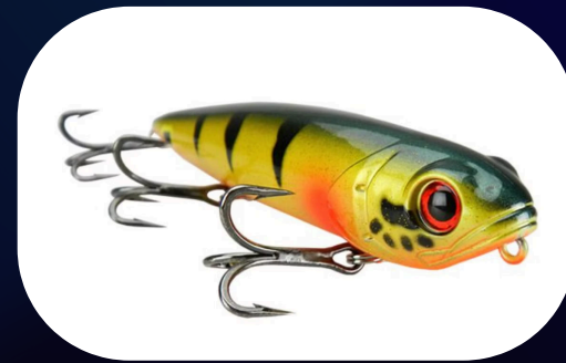
Joker 128 - Nitro Fishing