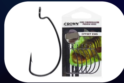
Anzol ewg - Crown