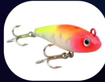
Curisco 110 - Nelson Nakamura