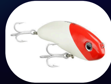
Safada - Borboleta