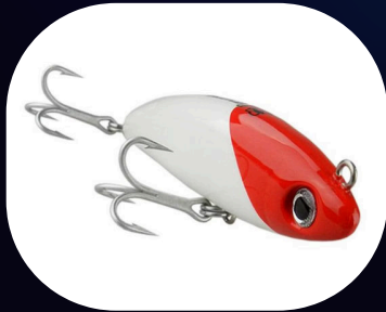
Perversa - Borboleta