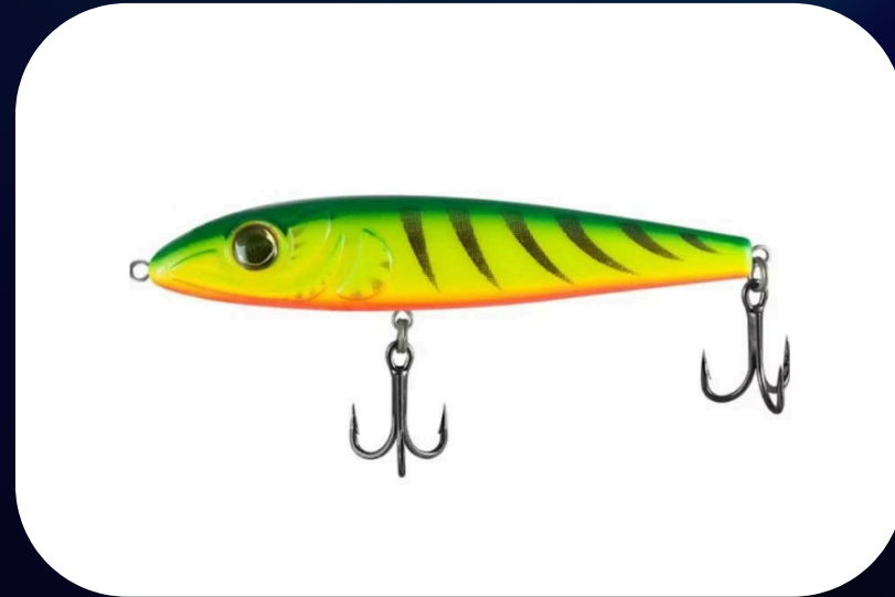
Stick 130 - Deconto