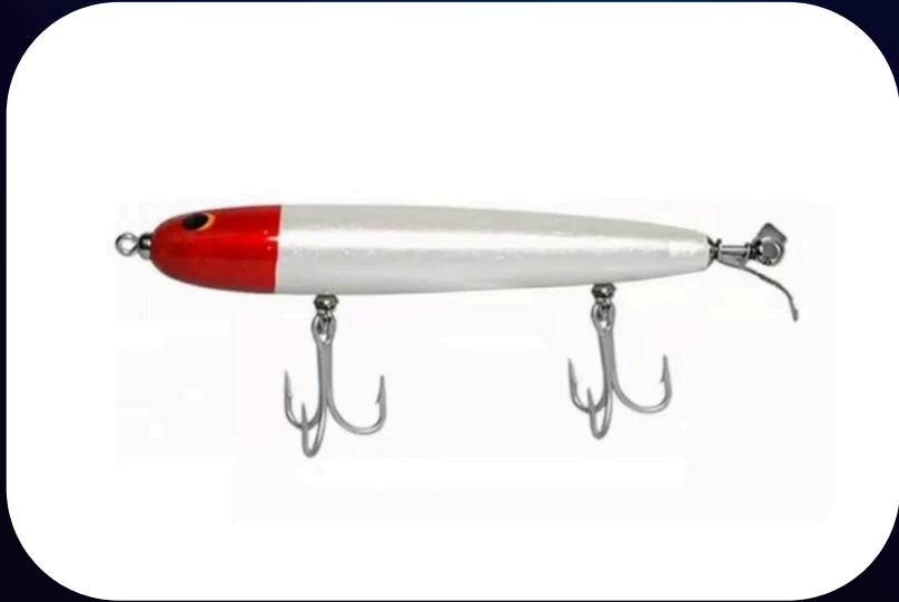
High Roller 5.25