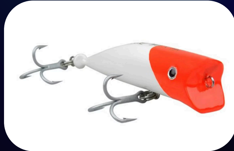
Stick Popper - Borboleta