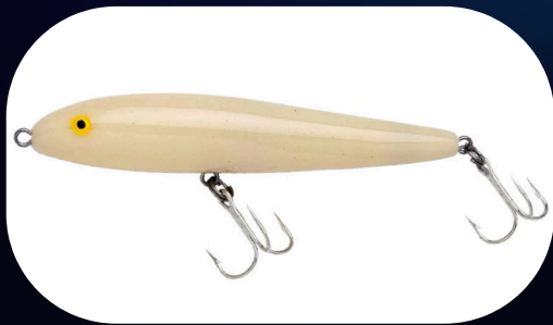
Jumping Minnow T20 - Rebel