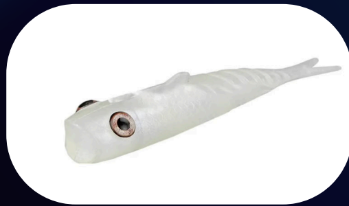
Pop Action 17 - Monster 3x