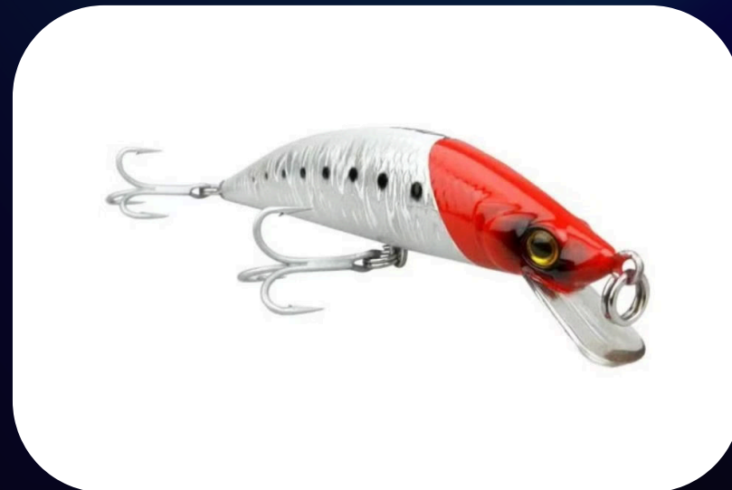
Inna 115 - Marine Sport